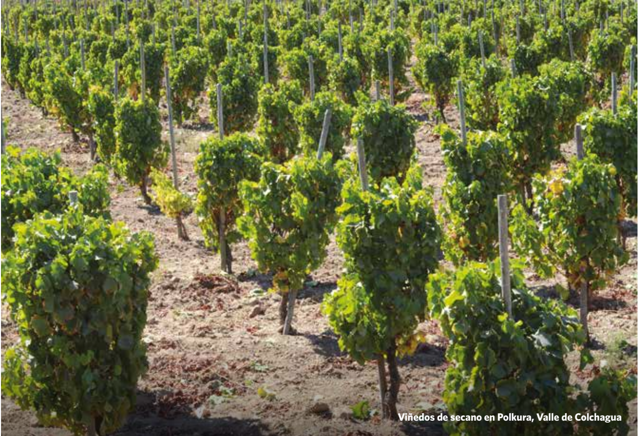
Viñedos de secano en Polkura, Valle de Colchagua