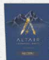
97 SAN PEDRO Altair C. Sauvignon, C. Franc, Syrah, Carménère 2019 CACHAPOAL ANDES