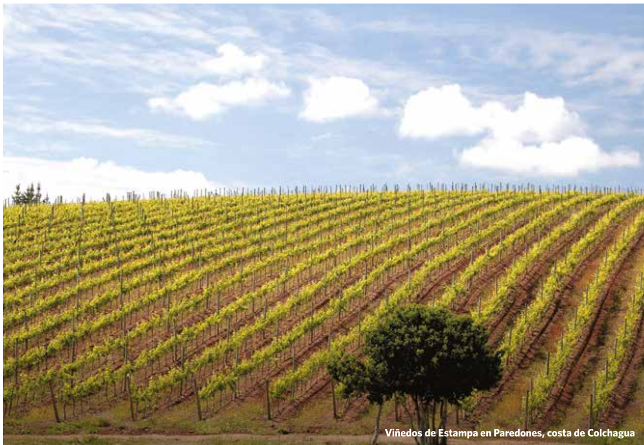
Viñedos de Estampa en Paredones, costa de Colchagua