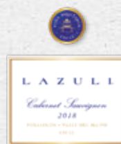
97 AQUITANIA Lazuli Cabernet Sauvignon 2018 MAIPO ANDES