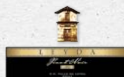
96 LEYDA Lot 21 Pinot Noir 2020 LEYDA