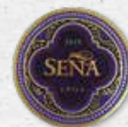
97 SEÑA Seña C. Sauvignon, Malbec, Carménère, P. Verdot 2019 ACONCAGUA