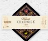
97 VIÑEDO CHADWICK Viñedo Chadwick C. Sauvignon 2019 PUENTE ALTO