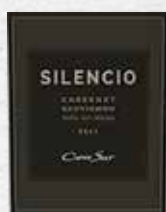
97 CONO SUR Silencio Cabernet Sauvignon 2017 MAIPO