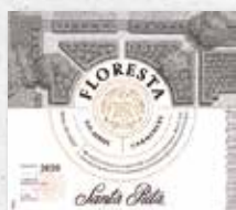
97 SANTA RITA Floresta Carménère 2020 APALTA