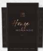
98 MORANDÉ House of Morandé 2019 MAIPO ANDES