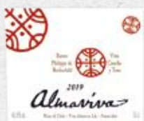
97 ALMAVIVA 2019 PUENTE ALTO